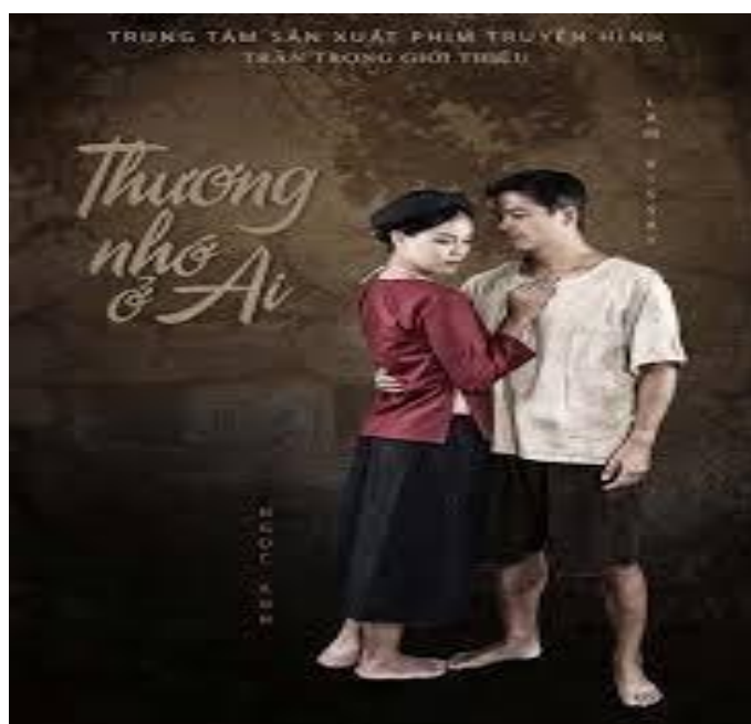
Hình 2: Hình ảnh trong phim Thương nhớ ở ai